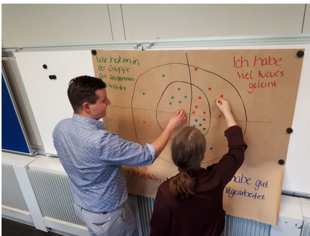
Abbildung 3: Lernende an der Planung und Evaluation von Unterricht zu beteiligen, fördert die Verantwortungsübernahme für den eigenen Lernprozess und die Gruppe.

Werden Schülerinnen und Schüler bei der Auswahl von Inhalten und Methoden einbezogen, dann lernen sie die Bedeutung von Demokratie und den Wert demokratischer Mitsprache in ihren konkreten, lebensweltlich relevanten Dimensionen kennen. Demokratische Beteiligung kann geübt, das Selbstverständnis und das Bewusstsein, die eigenen Interessen zu formulieren, zu begründen und zu diskutieren, können entwickelt werden. Hierfür ist es notwendig, dass Lernende die Partizipationsmöglichkeiten auch als solche wahrnehmen und gemeinsam reflektieren.