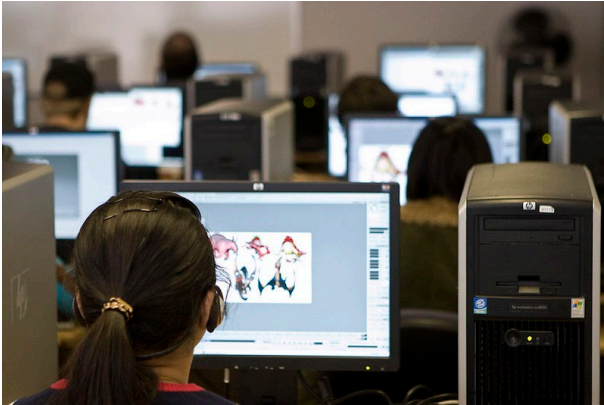
Abbildung 1: Demokratische Teilhabe in einer von Digitalität geprägten Gesellschaft macht es erforderlich, digitalisierungsbezogene Kompetenzen auch in ihrer Bedeutung für die Demokratiebildung zu reflektieren.

Auch Grundschul Kinder werden oft mit ihren Erfahrungen und Fragen allein gelassen. Gerade hier ist es von großer Bedeutung, diese Themen bereits frühzeitig aufzugreifen. Unterstützung bieten beispielsweise die Angebote der europäischen Initiative Klicksafe ( www.klicksafe.de ), die Medienkompetenzzentren in Berlin sowie speziell für Brandenburg das Netzwerkportal medienkompetenz-brandenburg.de als ein Projekt des Landesfachverbandes Medienbildung Brandenburg e. V. in Kooperation mit dem Landesinstitut für Schule und Medien Berlin-Brandenburg.