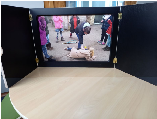
Abbildung 4: Das Erzähltheater Kamishibai bietet Gelegenheit, über Konflikte, ihre Verläufe und Bearbeitung zu sprechen.

Mit dem japanischen Papiertheater Kamishibai können Schülerinnen und Schüler publizierte Konfliktgeschichten nacherzählen oder eigene Bildergeschichten gestalten. Neben der sprachlichen und narrativen Förderung lässt sich – z. B. durch das Sortieren der einzelnen Bilder – eine Konflikteskalation nachvollziehen oder es können unterschiedliche Lösungsvarianten erprobt werden. Eigene Bilder lassen sich durch selbst erstellte Fotos oder Zeichnungen hinzufügen.