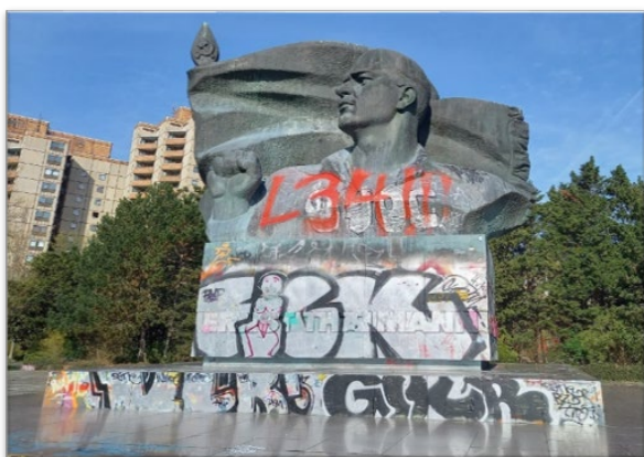
Abbildung 12: In der Auseinandersetzung mit Denkmälern, ihrer Geschichte, ihrer Veränderung und Wirkung können Lernende die politische Bedeutung von Kunst für den öffentlichen Raum und für Gesellschaft erschließen.

Weitere Informationen: https://denkmal-aktiv.de