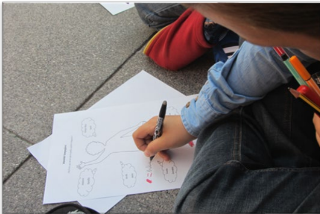
Abbildung 5: Die eigene Mehrsprachigkeit zu reflektieren bietet Gelegenheit, über demokratische Teilhabe zu diskutieren.

Weiterführende Hinweise und Anleitung: https://t1p.de/rapr