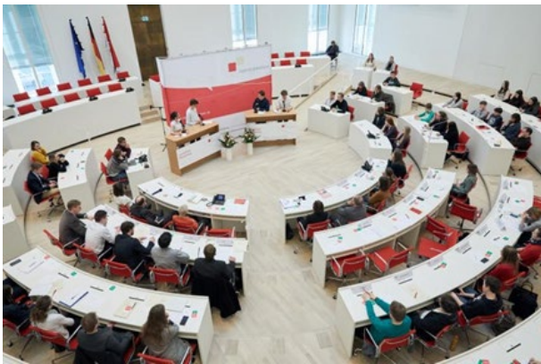
Abbildung 19: Im Wettbewerb Jugend debattiert trainieren Schülerinnen und Schüler ihre Diskussions- und Argumentationskompetenzen. Foto: © Landtag Brandenburg / Fabian Schellhorn, Landesfinale Jugend debattiert 2018

Mehr Informationen unter: https://www.jugend-debattiert.de