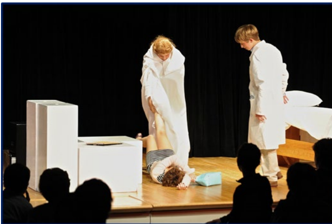
Abbildung 10: Im Darstellenden Spiel können eigener Ausdruck, Empathie und Perspektivwechsel trainiert und gesellschaftspolitische Themen zu Darstellung gebracht werden.

Gerade die gemeinsame Gestaltung von künstlerischen Prozessen und Produkten, das selbstständige Planen, Handeln und Verantworten fördern „das soziale Miteinander, [...] die Verantwortung des Einzelnen und die Verständigung in der Gruppe“ 54 . Im Erarbeitungsprozess erlernen Schülerinnen und Schüler „Demotiefähigkeit [...], befragen Haltungen, Handlungsmuster und gesellschaftliche Strukturen und erschließen sich im besten Fall neue Wege des Umgangs mit sich selbst, anderen Menschen“ und „lernen, Pluralität von Individuen und Gruppen zu respektieren“ 55 .