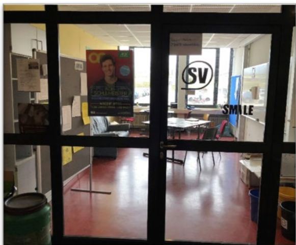
Abbildung 15: Die Sichtbarkeit der Schülerinnen- und Schülervertretung im Schulalltag, z. B. durch einen eigenen Raum, einen Briefkasten oder ein Schwarzes Brett, ist eine wichtige Voraussetzung für verbindliche Beteiligung.

Auf der schulübergreifenden Ebene stehen vielfältige Möglichkeiten wie Austausch oder Partnerschaften mit außerschulischen Kooperationspartnerinnen und -partnern offen. Sie bieten Kindern und Jugendlichen neue Erfahrungshorizonte und lassen das Erproben neuer Rollen zu. So können Schülerinnen und Schüler als Praktikantinnen und Praktikanten im Krankenhaus oder Unternehmen Kontakte knüpfen, sich in neuen Aufgaben ausprobieren und Einblicke in gesellschaftliche Zusammenhänge erlangen.