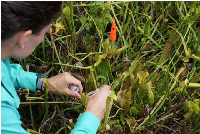
Abbildung 9: Untersuchungen in der Natur bilden die Grundlage für kommunale Initiativen.

Umweltprojekte in der Region bilden die Grundlage für ein kommunales oder regionales Engagement. In Service-Learning-Projekten können naturwissenschaftliche Unterrichtsinhalte mit einem Engagement in der demokratischen Gesellschaft verbunden werden. So könnten Lernende beispielsweise gesellschaftliche Probleme ausmachen und für diese im Fachunterricht Lösungen entwickeln. Die Unterrichtsinhalte werden hierdurch sinnstiftend angewendet und die Teilnehmenden erleben im Engagement Selbstwirksamkeitserfahrungen.