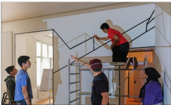
Abbildung 11: Schülerinnen und Schüler gestalten ihre Schule mit Tape Art.

Kinder und Jugendliche gestalten Schulräume gemeinsam, z. B. mit Tape Art. Sie setzen sich mit Fragen des Zusammenlebens auseinander und handeln aus, welche Werte der Schulgemeinschaft künstlerisch Ausdruck finden können und wer welchen Part an der Gestaltung übernimmt.