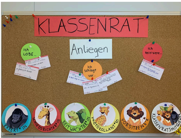
Abbildung 16: Anliegen- und Rollenkarten helfen dabei, den Ablauf des Klassenrats zu strukturieren, und unterstützen die Schülerinnen und Schüler beim Erproben demokratischer Verfahrensweisen. Foto: Lisa Oehmichen, CC BY-ND 4.0

Die Berliner Senatsverwaltung für Bildung, Jugend und Familie bietet auf ihrer Website umfangreiche Informationen zum Klassenrat: https://www.berlin.de/sen/bildung/unterricht/politische-bildung/klassenrat