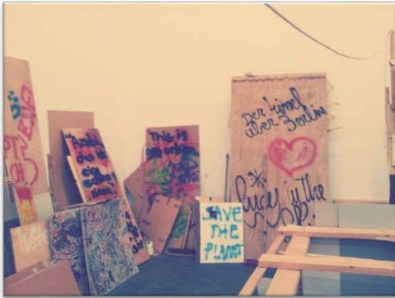
Abbildung 13: Protestplakate entwerfen im Kunstunterricht.

Kinder und Jugendliche setzen sich mit gesellschaftspolitischen Herausforderungen und Konflikten auseinander und reflektieren ihre Rolle als Bürgerinnen und Bürger. In eigenen Plakaten können sie ihren Positionen Ausdruck verleihen und künstlerische Gestaltungsmöglichkeiten im politischen Diskurs hinterfragen.