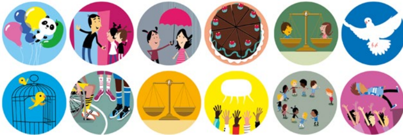
Abbildung 6: Die von Miriam Bauer entworfenen Wertekarten bieten niedrigschwellige visuelle Zugänge, um über Normen und Werte in der Klasse zu sprechen. Abbildung: Miriam Bauer, CC BY-ND 4.0

Weiterführende Hinweise unter: https://t1p.de/o6hv