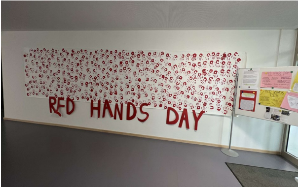
Abbildung 17: Red Hand Day: roter Handabdruck gegen Kindersoldatinnen und Kindersoldaten.