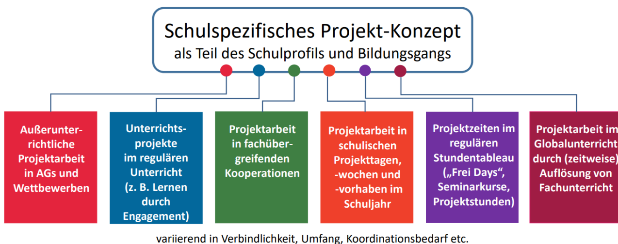
Abbildung 18: Zur Entwicklung eines schulspezifischen Projektkonzepts können Schulen unterschiedliche Projektformate in das Schulleben integrieren und im Bildungsgang der Lernenden entfalten.

Im Laufe des Schullebens sind Schülerinnen und Schüler in zahlreiche Projekte involviert. Das Spektrum reicht von kleineren Unterrichtsprojekten, über Vorhaben zu besonderen Anlässen wie dem Weltfrauentag bis hin zu Projektwochen als schulübergreifende Veranstaltung oder ein mehrwöchiger fachübergreifender oder fächerverbindender Unterricht an Stelle von regulärem Fachunterricht. Gerade aufgrund dieser Vielzahl an Formaten bieten sich Schulen mannigfaltige Möglichkeiten, Projekte als Bauform für Demokratiebildung in ihr demokratisches Schulprofil aufzunehmen.