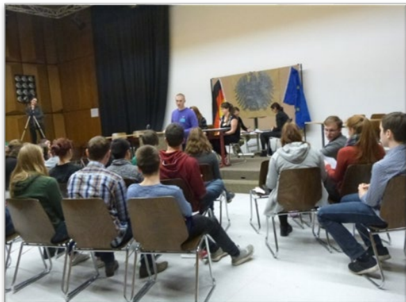
Abbildung 7: In Planspielen können Lernende politische Institutionen aus der aktiven Perspektive erleben und politische Prozesse in ihrer Sinnhaftigkeit und Funktionsweise erschließen.

Neben kommunalen Themen („Windräder in unserem Dorf?“) werden Gesetzgebungsprozesse des Bundestages und des EU-Parlaments, internationale Verhandlungen (z. B. Model United Nations) und historische Ereignisse (Herodots Bericht über die Verfassungsdebatte im antiken Griechenland) simuliert. Zudem bieten verschiedene Organisationen und Institutionen die Durchführung von Planspielen für Schulklassen an (vgl. Serviceteil).