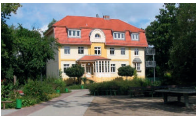
Grundschule Beetz – teilnehmende Schule

Die Stipendienzeit beinhaltet ein insgesamt 20-tägiges Praktikum an der Bedarfsschule (eine Aufteilung ist möglich). Sammeln Sie auf diese Weise erste Erfahrungen an Ihrem späteren Arbeitsort.