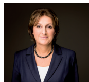
Britta Ernst Ministerin für Bildung, Jugend und Sport Land Brandenburg

12:30 Pressegespräch und Rundgang „Markt der Möglichkeiten“