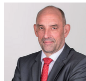
Detlef Scheele Vorstandsvorsitzender der Bundesagentur für Arbeit (BA)